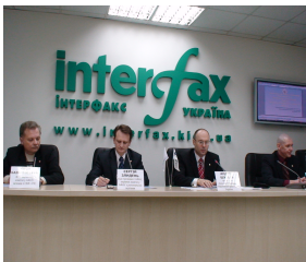
Пресс-конференция по вопросам КРИЗИСНЫЕ ЯВЛЕНИЯ - КАТАЛИЗАТОР РЫНКА НЕДВИЖИМОСТИ

-Антикризисные действия и законодательные инициативы (способы решения возникающих проблем):